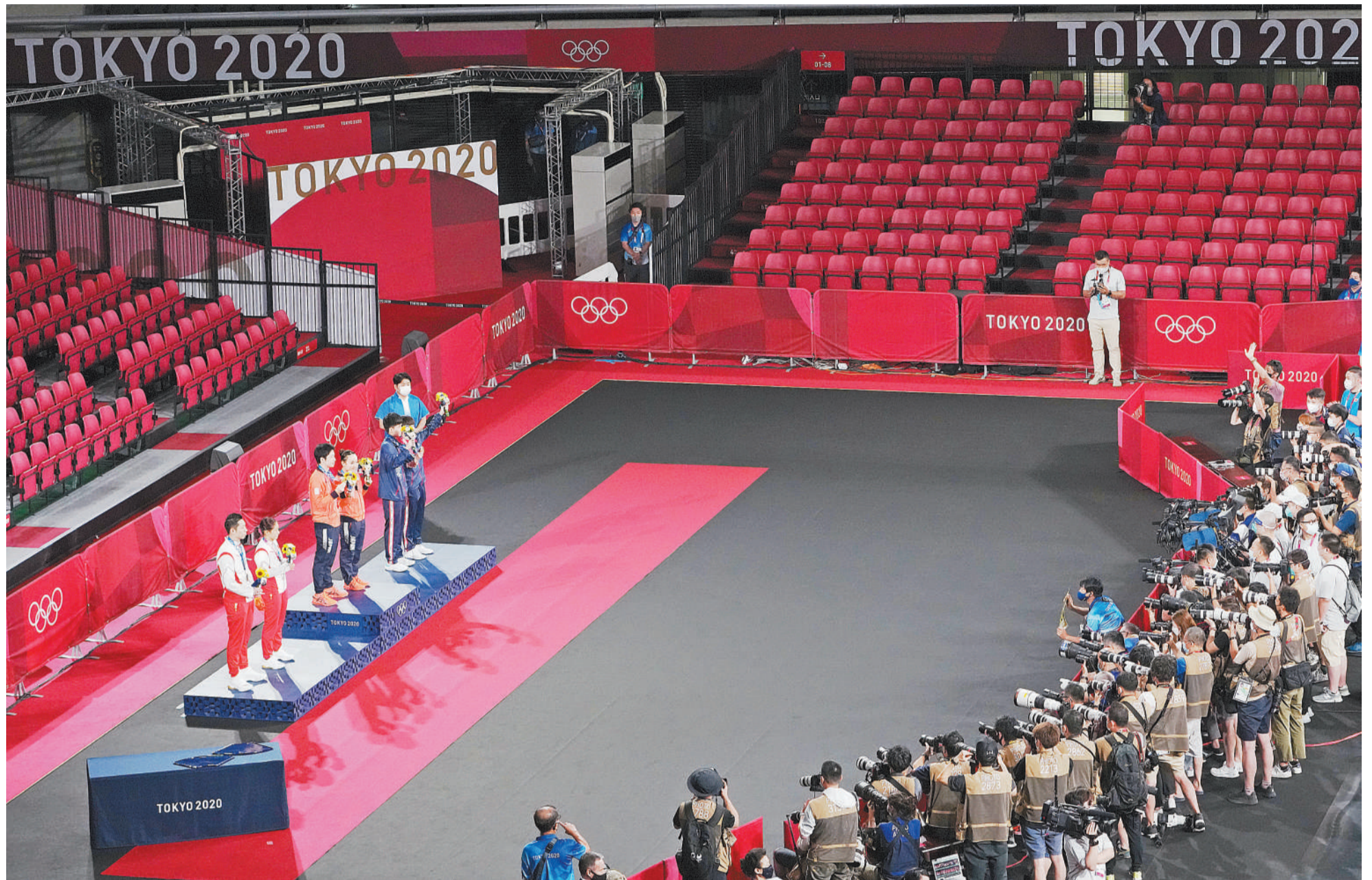
7月26日,2020东京奥运会一场乒乓球比赛决赛的颁奖典礼上,摄影记者保持防疫规定距离,在挡板后拍摄获奖选手。不远处的观众席上几乎没有人,显得十分冷清。出于防疫需要,本届奥运会主办方绞尽脑汁,陆续出台了多项举措,禁止观众入场观看比赛,是他们作出的最艰难,或许也是最正确的决定。

全球的新冠肺炎疫情,让推迟到2021年夏天举行的2020东京奥运会举办维艰,也让其在灿若星河的奥林匹克历史上,留下极为特殊的一笔。