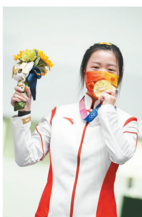
7月24日,日本东京朝霞射击场,2020东京奥运会女子10米气步枪决赛颁奖现场,夺得本届奥运会首金的杨倩隔着口罩亲吻金牌。