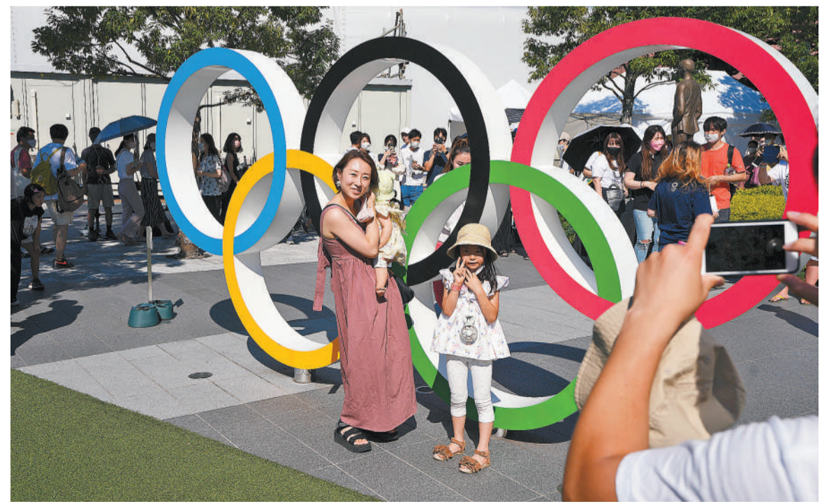
8月1日,日本东京新国立竞技场门口的奥运五环标志成为市民们的打卡地,人们冒着高温排着长队,只为跟五环标志合个影。