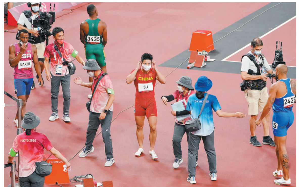
8月1日,在2020东京奥运会男子100米半决赛中,中国飞人苏炳添(中)以9秒83的成绩打破亚洲纪录,并成功进入决赛。当他庆祝时,多名记者和工作人员围着他,随后苏炳添尽快戴上了口罩。