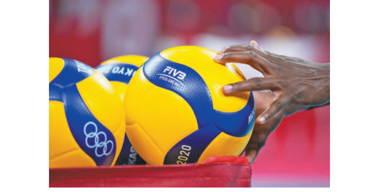
7月27日,2020东京奥运会一场排球比赛中,一名运动员在球筐里取出工作人员擦拭干净的排球。