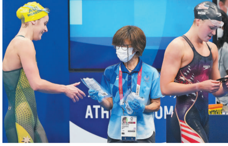
7月31日,2020东京奥运会一场游泳比赛结束后,工作人员立即向运动员递上口罩。