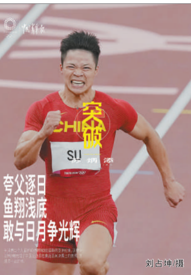
夸父逐日 鱼翔浅底 敢与日月争光辉