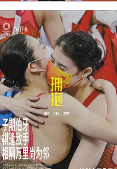
拥抱 子期伯牙 棋逢敌手 相隔万里尚为邻