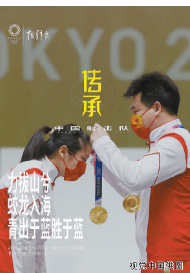
传承 中国足球队 力拔山河 蛟龙入海 青出于蓝胜于蓝