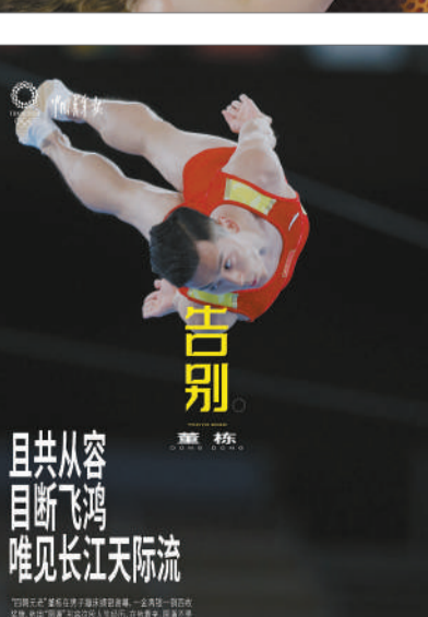
告别 且共从容 目断飞鸿 唯见长江天际流