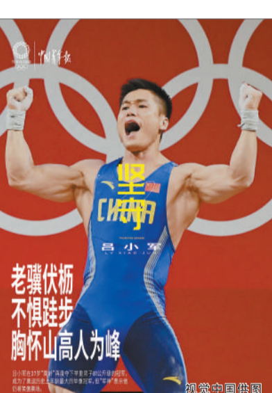
老骥伏枥 不惧陡步 胸怀高山人为峰