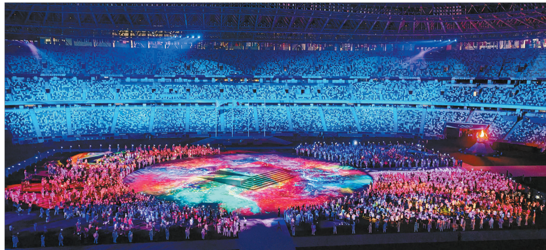
8月8日，东京奥运会闭幕式在东京新国立竞技场举行。

东京奥组委还给奥运相关人员制定了严格的防疫要求，例如，严格禁止奥运代表团的运动员、教练员、官员与日本社会发生直接接触（在奥运区域之外观光、购物、就餐等）。个别违反这一政策的代表