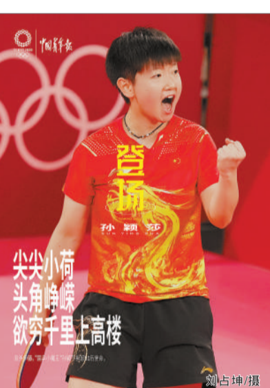
尖尖小荷 欲穷千里上高楼 头角峥嵘