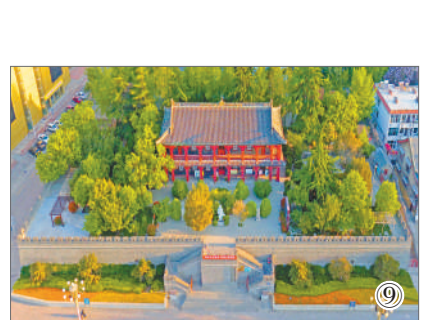
④南旺分水岭遗址 杨焕勇/摄 ⑤《孔子为鲁司寇图轴》(明) 陈鼎/摄 ⑥祭孔大典现场 杨国庆/摄 ⑦夫子洞 陈鼎/摄 ⑧南池湖畔的李白、杜甫像 陈鼎/摄 ⑨太白楼 李晖/摄