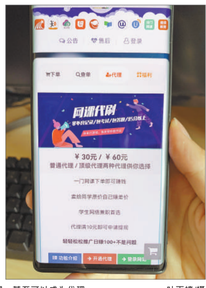
在一个网络刷课平台,学生可以选择多种课程平台刷课,甚至可以成为代理。