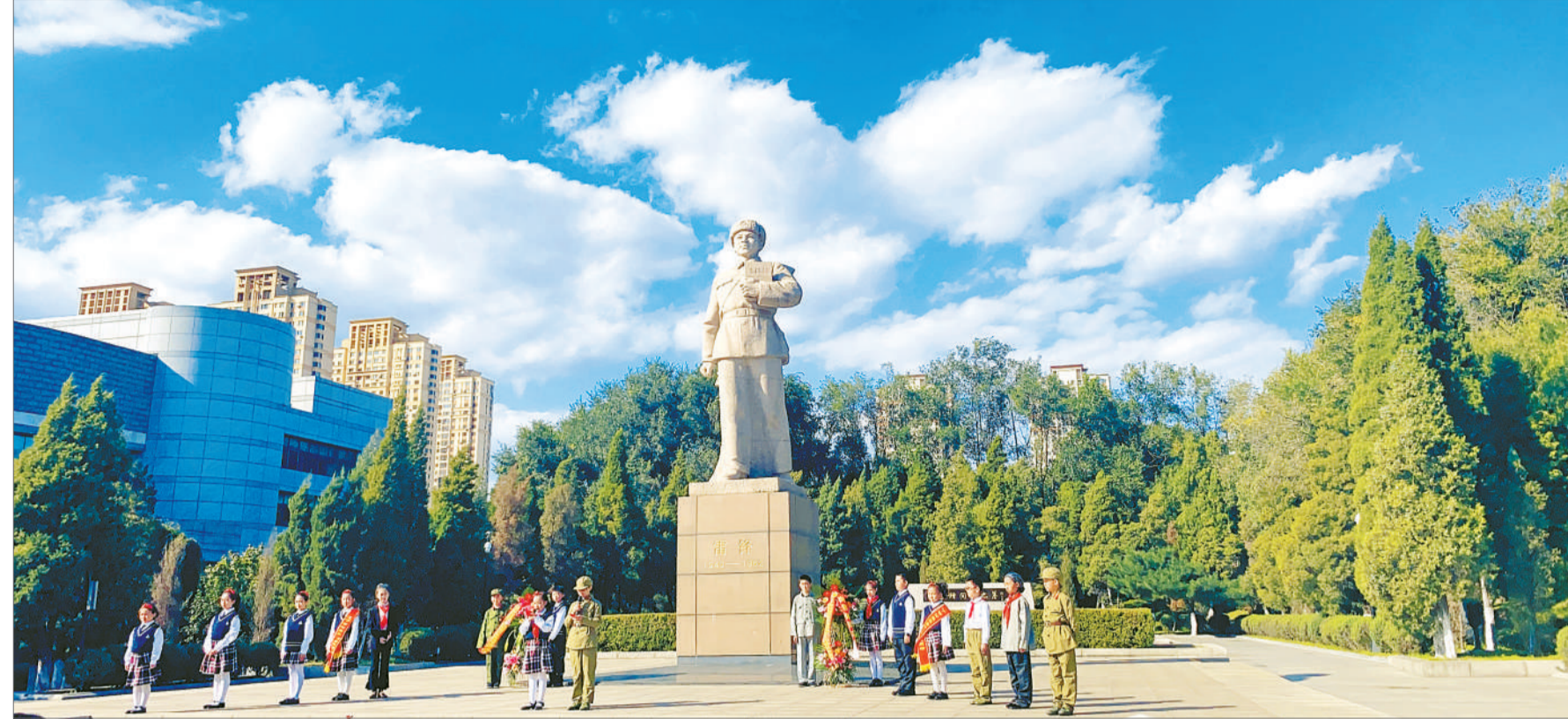
小小志愿者在抚顺市雷锋纪念馆伟人题词碑前演出《做雷锋式的好少年》情景剧。