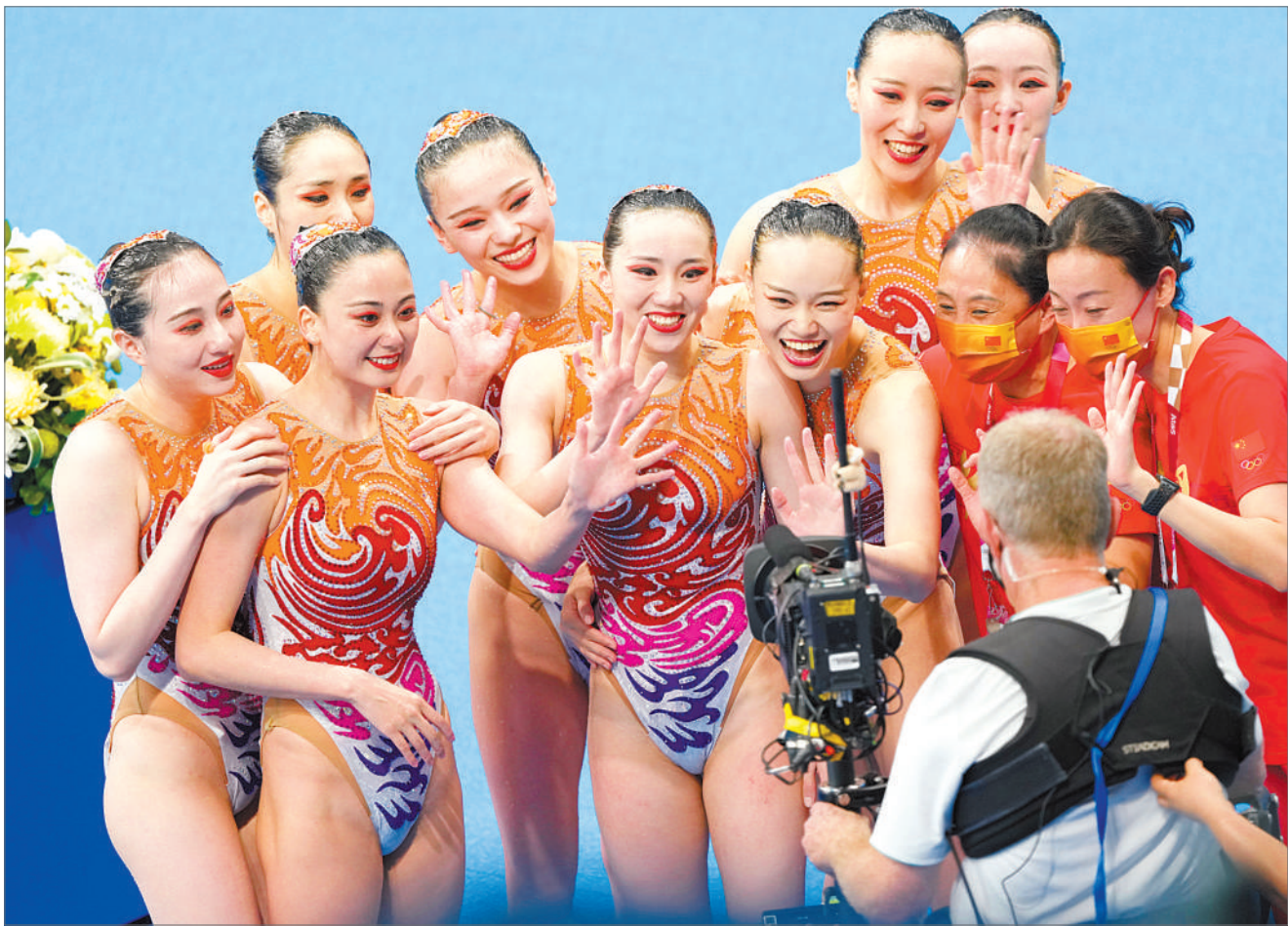
获得东京奥运会花样游泳集体项目银牌的中国姑娘,对着镜头打招呼、摆造型。