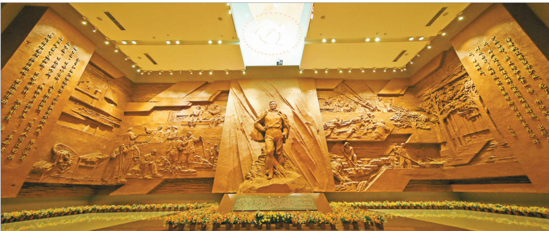
河南省兰考县展览馆序厅内，焦裕禄铜像巍然屹立。