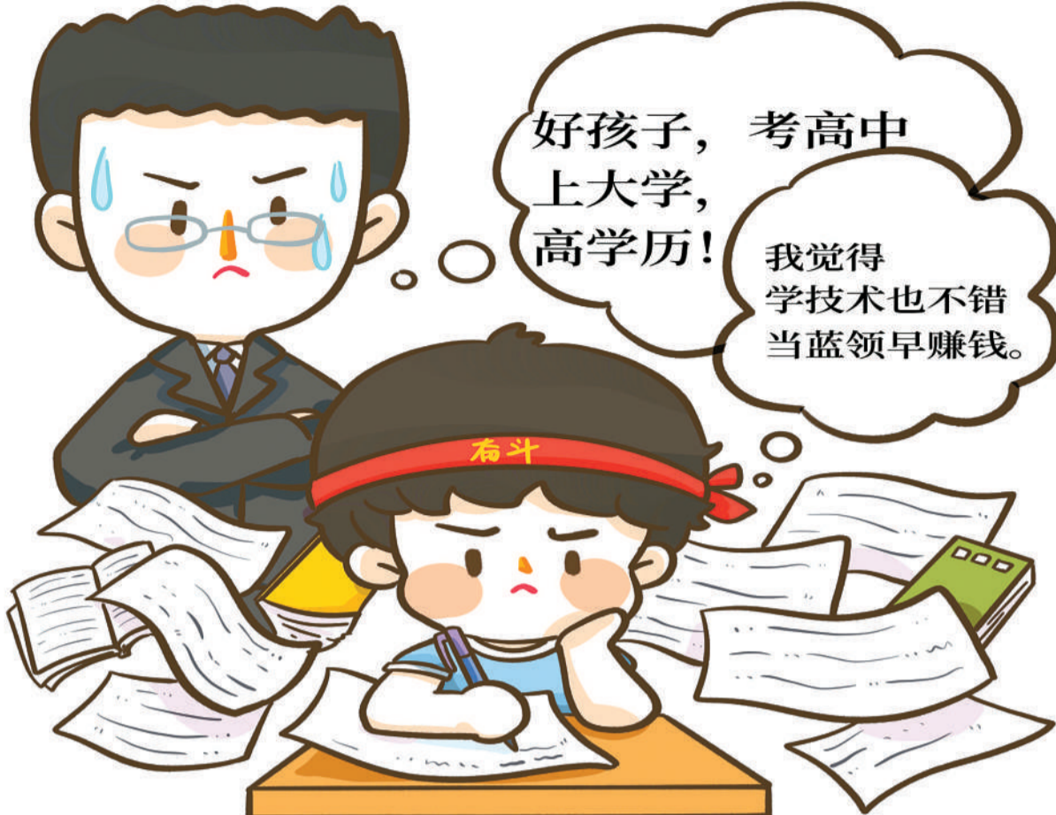
面对普职分流,家长、孩子如何抉择。

社团思政要突破传统的思政教育和社团建设理念,通过聚焦建设党委领导下的社团机构、师资队伍、思政条件、课程建设的思政内容、实践活动的思政元素等,擦亮思政名片,构建凸显思政文化的学生社团,形成思想领先,多领域、多层次、各具特色的社团文化育人局面,全面提升高职院校思政教育的效果。(作者系湖南化工职业技术学院副院长)