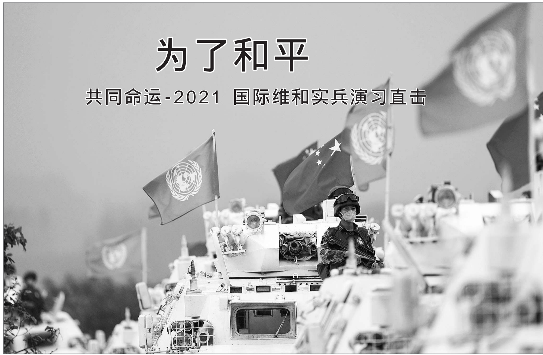
吕德胜 李伟欣 张毓津 孟晓锋 田磊

9月15日，共同命运-2021国际维和实兵演习在确山某训练基地落下帷幕。来自中国、蒙古国、巴基斯坦、泰国等国1000余名参演官兵混合编组、联合指挥、一体行动，围绕多国维和部队联合行动课题，共同完成临时行动基地建设、警戒巡逻、武装护卫、保护平民、应对暴恐袭击等多课目连贯演练。