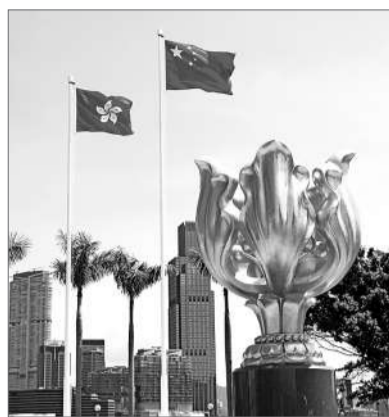
香港金紫荆广场(资料图片)