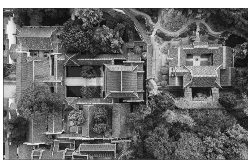
岳麓书院俯瞰图。

镇 后随父母到县城定居。在这个方圆不超过两公里的县城 我度过了我的幼儿园、小学、初中和高中。18岁这一年 我突破了父母期待的人生轨迹 跨越山河 求学于千里之外的湖南长沙。