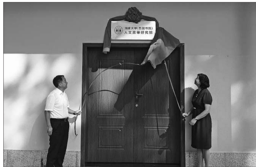
9月12日 湖南大学(岳麓书院)人文高等研究院在长沙正式成立。