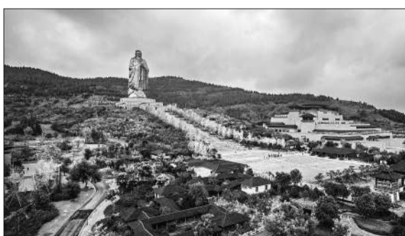
9月27日 山东曲阜 2021中国(曲阜)国际孔子文化节和第七届尼山世界文明论坛在尼山举行。

一般来说 一座城市最繁荣的时候 往往是它建都的时候。但曲阜打破了这个规律 因为孔子 它的受关注程度没有因为鲁国的灭亡而降低 反而越来越高。曲阜肥沃的文化土壤哺育出了孔子 孔子又给生养他的曲阜带来了长达2000多年的荣耀。这种现象 在中国城市史上独一无二。