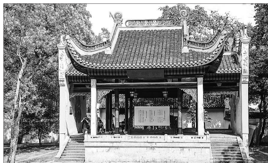
岳麓书院赫曦台。