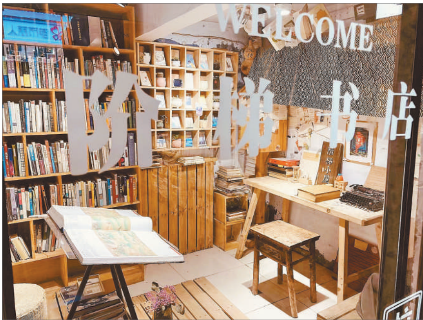
河南新乡的阶梯书店。