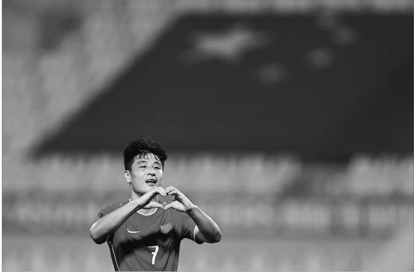
前锋武磊是国足唯一海外联赛效力球员。