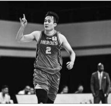
复出的丁彦雨航在比赛中。