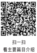
扫一扫 看主要目录介绍

当家作主，是习近平新时代中国特色社会主义思想的重要组成部分，对于坚持中国特色社会主义政治发展道路，推进全过程人民民主建设，完善和发展中国特色社会主义制度、推进国家治理体系和治理能力现代化，夺取全面建设社会主义现代化国家新胜利、实现中华民族伟大复兴的中国梦，具有十分重要的指导意义。