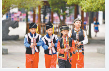
10月27日,在广西融安县第二实验小学,学生们在吹奏民族乐器 巴乌。