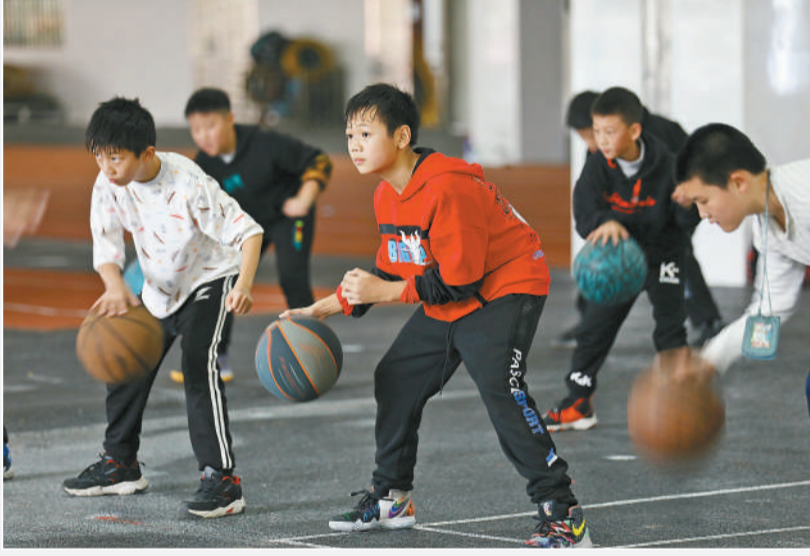
10月29日,湖南省资兴市鲤鱼江完全小学,学生练习篮球。