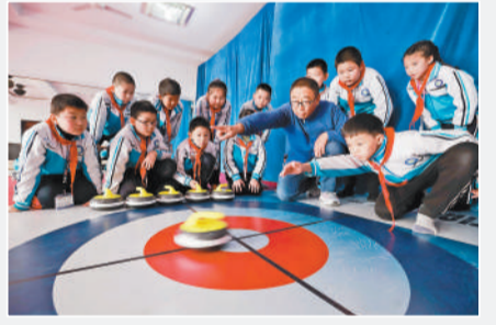
10月29日,河北省遵化市第三实验小学的老师指导学生投掷陆地冰壶。