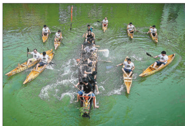
美丽水乡碧水戏龙