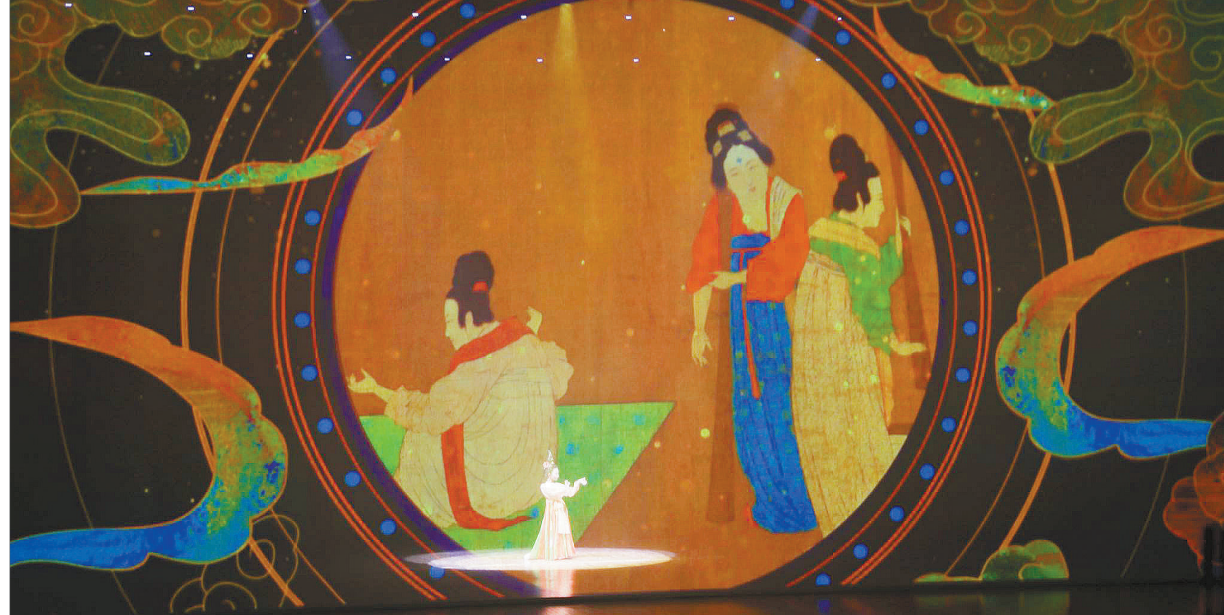
古金灵(@嘎嘎灵)彩排现场