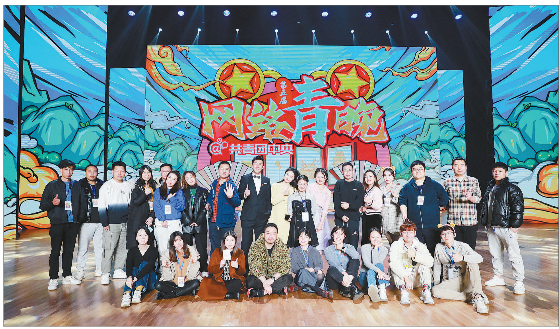
第五届网络青晚全体工作人员合影