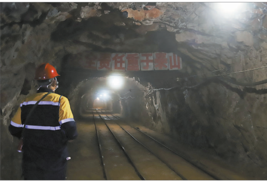
一名矿工走在矿井前方，其上方写着：安全责任重于泰山。