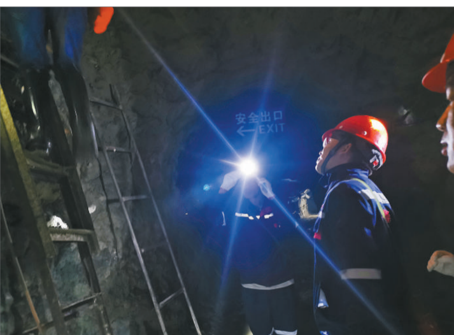
明查暗访组专家检查发现，蒙自矿冶矿井的中段安全出口数量不符合规范要求。

日前，国务院安委办明查暗访组深入云南红河州的蒙自市、建水县、个旧市的非煤矿山进行抽查检查，中青报 中青网记者全程跟组采访。