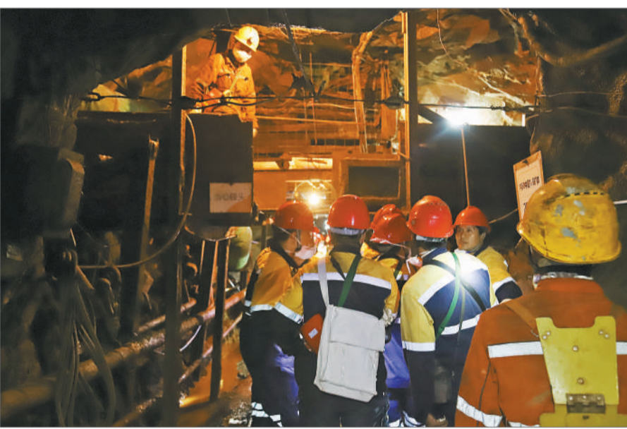
在建水县官厅鑫隆矿业开发有限责任公司的荒田铅锌矿下，明查暗访组专家爬上了另一个巷道进行检查，矿工们在下面的巷道等待。