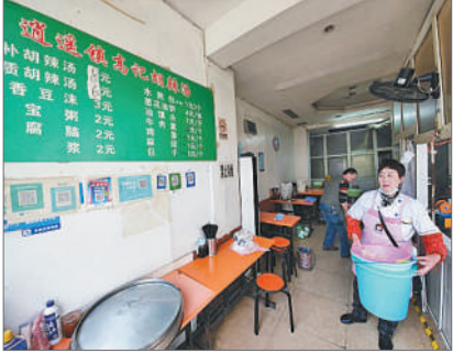
11月22日，郑州市区一家店名带有“逍遥镇”的胡辣汤店内，食品销售一空。

不过，逍遥镇胡辣汤显然希望重走沙县小吃走过的路。今年6月，西华逍遥镇胡辣汤制作技艺被列入文化和旅游部确定的第五批国家级非物质文化遗产代表性项目名