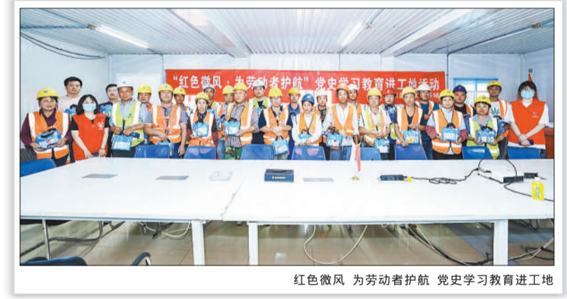
红色微风 为劳动者护航 党史学习教育进工地

位于太湖新城的科技型企业科沃斯,有一个齐腰高的智能机器人吴小新,是众多年轻党员口中的开