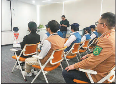
机器人宣讲商超(歌林小镇)