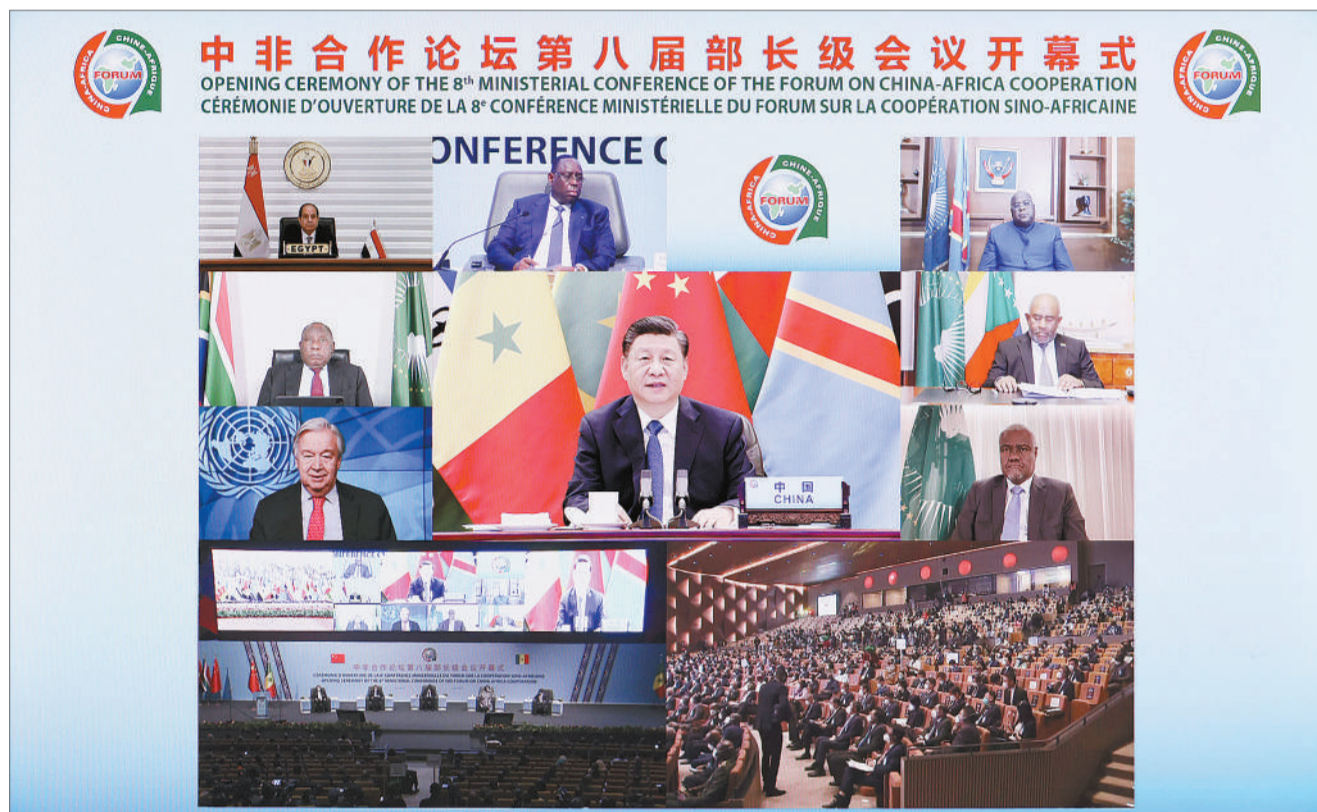
11月29日晚,国家主席习近平在北京以视频方式出席中非合作论坛第八届部长级会议开幕式并发表题为《同舟共济,继往开来,携手构建新时代中非命运共同体》的主旨演讲。

新华社北京11月29日电(记者郑明达)国家主席习近平29日晚在北京以视频方式出席中非合作论坛第八届部长级会议开幕式。 人民大会堂东大厅内,中国和53个非洲国家国旗以及非洲联盟旗帜组成的旗阵恢弘大气、热烈奔放,昭示着中非历久弥坚的友好情谊。 习近平发表题为《同舟共济,继往开来,携手构建新时代中非命运共同体》的主旨演讲。 习近平指出,今年是中非开启外交关系65周年。65年来,中非双方在反帝反殖的斗争中结下了牢不可破的兄弟情谊,在发展的征程上走出了特色鲜明的合作之路,在纷繁复杂的变局中谱写了守望相助的精彩篇章,为构建新型国际关系树立了光辉典范。 习近平强调,中非关系为什么好?中非友谊为什么深?关键在于双方缔造了历久弥坚的中非友好合作精神,那就是:真诚友好、平等相待、互利共赢、共同发展、主持公道、捍卫正义、顺应时势、开放包容。这是