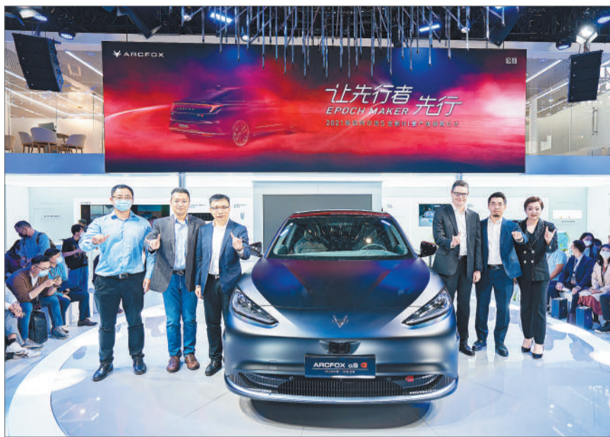
作为首款搭载华为智能座舱-鸿蒙车机 OS 的高端纯电量产轿车,阿尔法 S 全新 HI 量产版不仅汲取了北汽多年优秀的造车品质,也将华为在自动驾驶技术和智能领域的特点发挥得淋漓尽致。

近日,在 2021 广州国际车展上,极狐旗下的最新产品阿尔法 S 全新 HI 量产版车型完成首秀,按照规划,阿尔法 S 全新 HI 量产版将于 12 月 25 日品鉴之夜小批量交付。