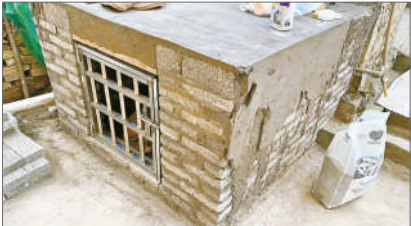
甜甜位于刘伍兵院子里的新家。