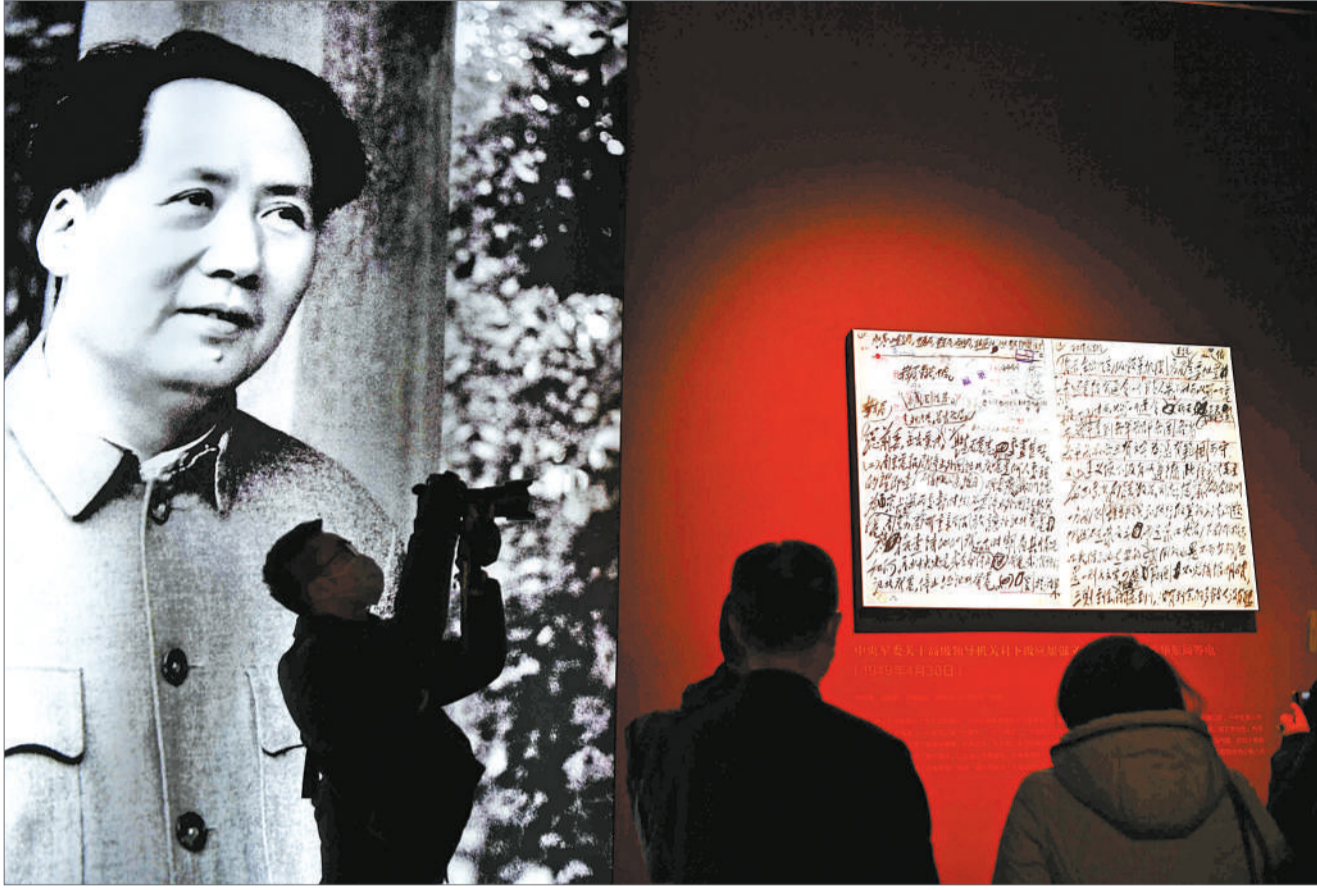
2020年12月16日，在北京香山革命纪念馆，参观者拍摄展出的毛泽东电报手稿。