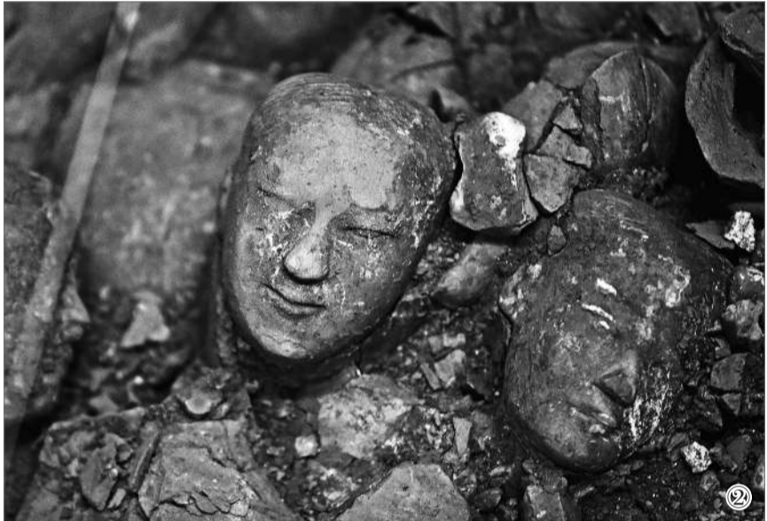
①薄太后南陵外藏坑出土文物。 国家文物局供图 ②江村大墓（霸陵）外藏坑出土的陶俑。 视觉中国供图 ③江村大墓与凤凰嘴、南陵、窦皇后陵位置关系。 国家文物局供图 ④2021年12月14日，西安，实拍江村大墓（霸陵）外藏坑挖掘现场。 视觉中国供图

陵风水极佳，施工有条不紊，文帝兴奋地说道，嗟乎！以北山石为椁，用紵絮陈漆其间，如果用北山的石头做成棺槨，把麻絮切碎填充在石头缝隙中，再用漆将石头、麻絮黏合为一体，那任谁即使有金钢钻也无法撬开霸陵。