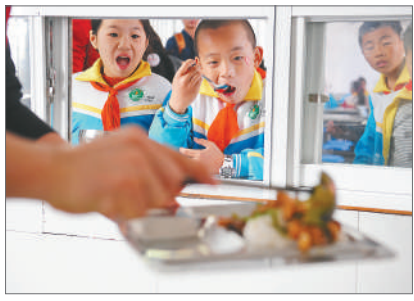
安徽池州，位于大山深处的一所学校，孩子们正在学校的餐厅里准备用餐。