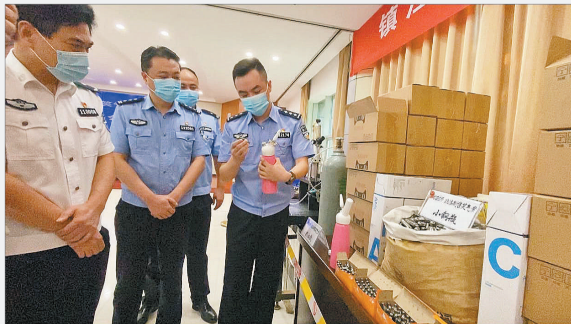
▲9月10日，镇江警方在O209非法制售笑气案新闻通气会上，讲述笑气的加工制作流程与案情等相关情况。李超/摄 ▲此图为将笑气灌装在小钢瓶内的灌装机。李超/摄 ▶镇江警方查获的非法灌装笑气的加工机器。镇江警方供图