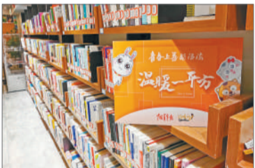
更读书社借阅区, 中青报 中青网见习记者 陈鼎/摄