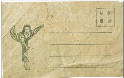
乐伊莉滑冰图案的信封。