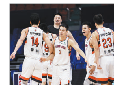
1月9日,吉林长春,广州男篮以113-104击败浙江稠州金租队。

由此可见,大学生球员想要在职业联赛立足,实力、环境、努力等内外因素缺一不可,这也让他们的职业生涯显得更加艰辛。但既然已经进入职业联赛,大学生球员的身份其实就变成了一个注脚,外界并不会因为这个特殊身份,而在残酷竞争中展现出仁慈的一面,大学生球员在职业联赛的生存之道,说到底还是需要自己摘下头顶的皇冠,因为适者生存是放之四海皆准的法则。