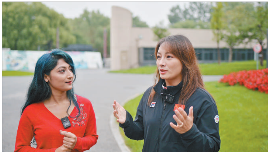
左图:李妮娜(右)在接受我在中国看冬奥主持人陶天的采访。右图:2006年2月22日,意大利都灵,第20届冬季奥运会,女子自由式滑雪空中技巧,李妮娜夺得银牌。

敢想象,中国会举办一届冬奥会。李妮娜知道,相比起实力已经非常强大的中国夏季项目,中国的冬季项目还显得基础薄弱。但北京申办2022年冬奥会,正好可以给中国冰雪运动的起飞插上翅膀。2014年索契冬奥会结束之后,李妮娜成为北京申办2022年冬奥会形象大使,并将作为陈述人之一,在2015年7月31日举行的国际奥委会全会上为北京申办2022年冬奥会作陈词发言。因为全程英文发言,李妮娜曾担心自己无法胜任这项工作,但事实证明,李妮娜的英文发言既动情又流畅。作为北京申冬奥代表团的一分子,李妮娜在又一个冬奥赛场上做到了不辱使命。申冬奥成功,对于中国冰雪运动的发展来说是千载难逢的历史机遇。作一名冰雪人,李妮娜兴奋地表示,北京冬奥会给了中国体圆了冬奥梦。2008年,我们圆了夏奥梦,现在,我们又圆了冬奥梦,北京申办冬奥会将给中国的冬季运动发展带来很大的推动。从事滑雪运动的李妮娜很清楚,在北京申办冬奥会之前,中国还有大约三