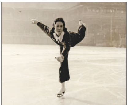
乐伊莉参加女子花样滑冰比赛旧照片。