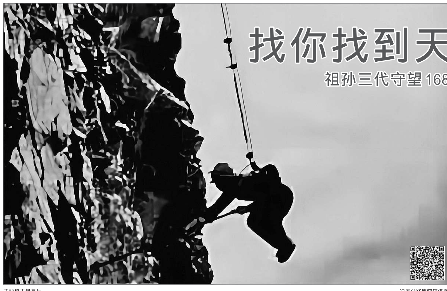
飞线施工修复后 独库公路博物馆供图