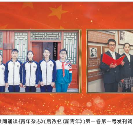
两地青少年共同诵读《青年杂志》(后改名《新青年》)第一卷第一号发刊词《敬告青年》。

1917年, 陈独秀把《新青年》编辑部由上海迁到北京。随着北京大学教授加入, 《新青年》逐渐由一个以安徽读书人为中心的地方刊物转变为全国性的畅销刊物。