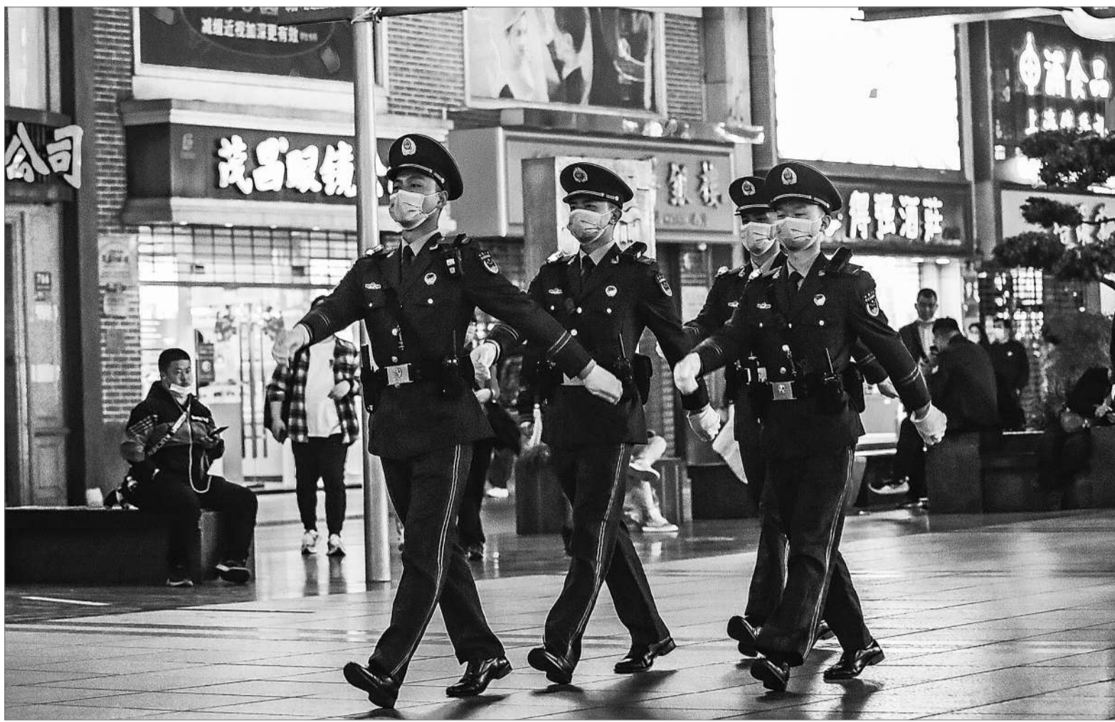
武警上海总队执勤第四支队执勤三大队官兵在南京路上巡逻执勤。

在不久前的元旦小长假里,上海南京路上的武警网红人墙 又燃爆网络,这道武警官兵用身体筑起的安全屏障,让成千上万的游客看到了人民军队爱民为民的本色,成为霓虹灯下的独特风景,网友们纷纷留言点赞:每一帧都帅爆!致敬最可爱的人!