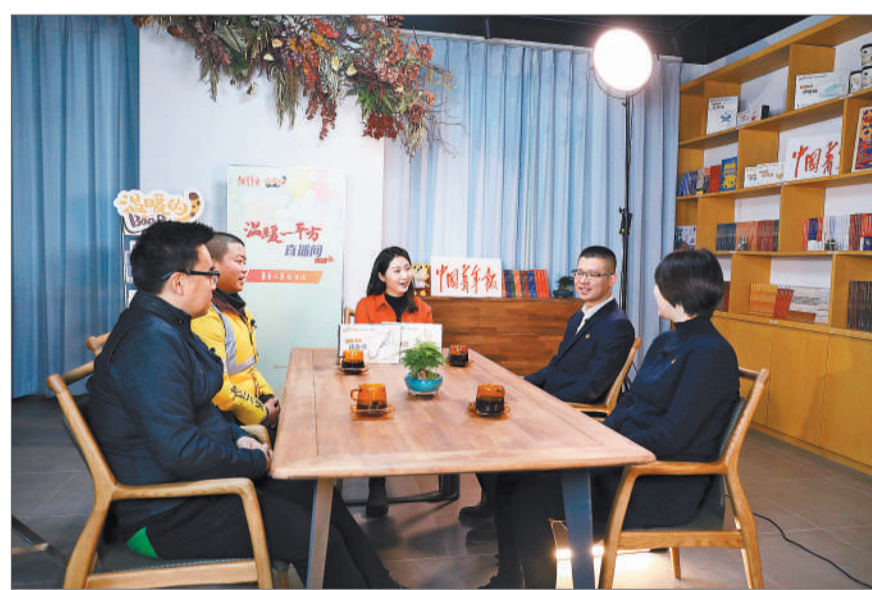
《面对面》之青年发展直播现场。