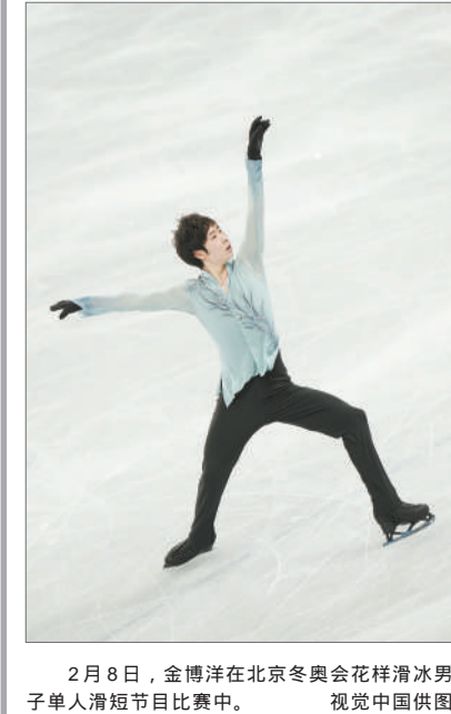
2月8日，金博洋在北京冬奥会花样滑冰男子单人滑短节目比赛中。