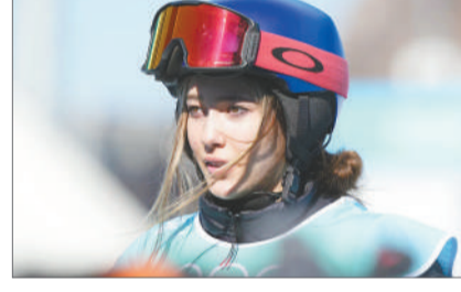
2月8日，中国选手谷爱凌在赛后接受采访。中青报 中青网记者 李隽辉/摄

不过，无论能否夺金，当谷爱凌带着明媚的性格和鲜明的态度站上赛场，人们已经明显感受到这位女孩超越赛场的魔力，胜也爱凌，负也爱凌。