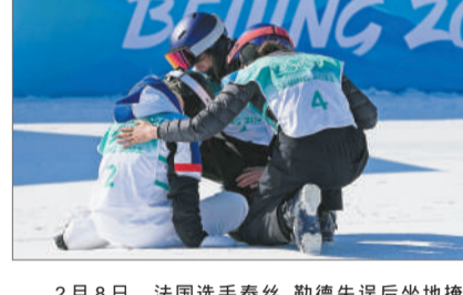
2月8日，法国选手泰丝·勒德失误后坐地掩面，谷爱凌跑上去拥抱安慰。

电视里、楼宇间的霓虹灯牌、地铁里的巨幅海报、公交站广告牌、App开屏画面、日用品包装，冬奥会闭环内酒店大堂中英文报纸的头版、酒吧一角的杂志封面、媒体班车上各国记者的寒暄里，谷爱凌无处不在。