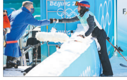
2月8日，中国选手谷爱凌挑战高难度动作成功后，与观战的国际奥委会主席巴赫击拳庆祝。