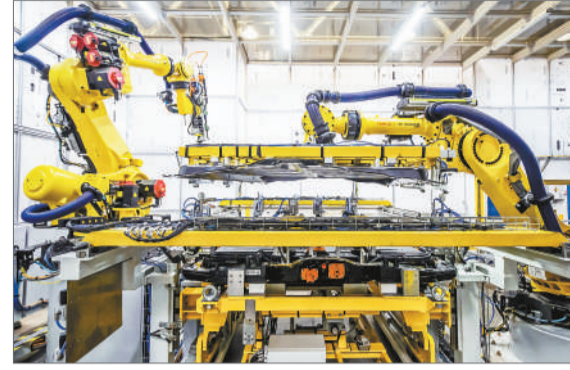
随着2021年10月奥特能超级工厂在上海金桥基地的竣工投产,以及泛亚新能源试验大楼和广德电池安全实验室相继启用,上汽通用已具备从技术研发、试验验证、本土采购到生产制造全链路的新能源完整体系能力。图为Ultium电池壳体进行100%自动化上盖安装。

据了解,作为通用汽车全面电动化的基石,奥特能电动车平台整合了通用汽车26年的电动化经验和前瞻技术,凭借更智能、更安全、更性能的优势,为消费者带来