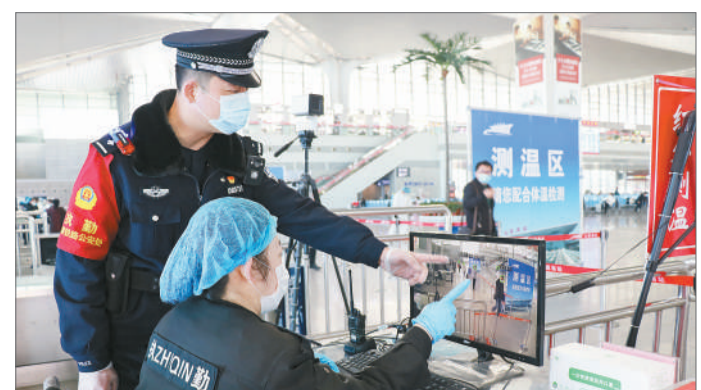
春运期间,太原铁路公安局太原公安处团委组织青年志愿者积极主动协同车站工作人员严格落实疫情防控措施,对所有进站旅客进行体温检测,图为青年志愿者查看进站旅客体温检测情况。