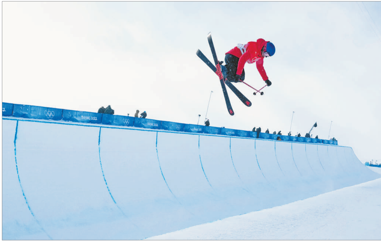
2月18日,北京冬奥会张家口赛区,谷爱凌在自由式滑雪女子U型场地技巧决赛上。

无数次在气垫和雪场间切换,何金博喜欢上了解锁大招的成就感以及滑雪文化中自由、尊重创意的一面。进步来得很快,在北京冬奥会自由式滑雪大跳台比赛中,何金博在2月7日的资格赛第三跳中,完成了两周偏轴转体1800,这是他目前做过的最高难度的动作,也是他第二次在世