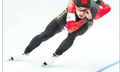
2月18日,北京冬奥会,宁忠岩以1分08秒60的成绩,在速度滑冰男子1000米比赛中获得第五名。