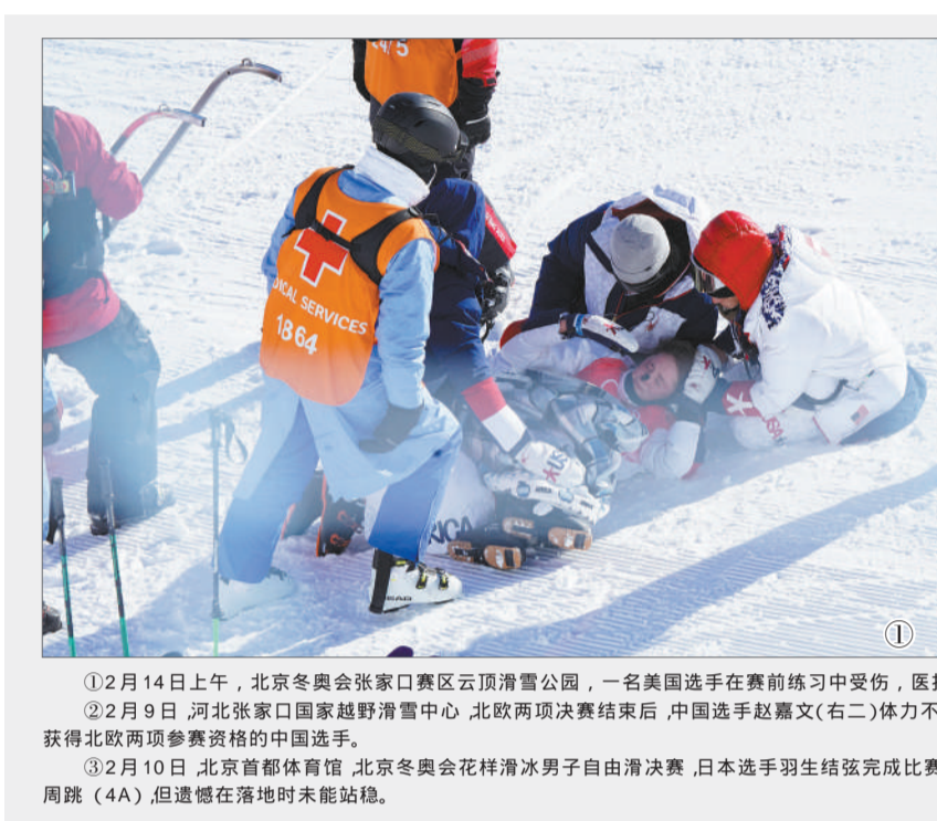
①2月14日上午，北京冬奥会张家口赛区云顶滑雪公园，一名美国选手在赛前练习中受伤，医护人员上前查看。 ②2月9日，河北张家口国家越野滑雪中心，北欧两项决赛结束后，中国选手赵嘉文(右二)体力不支，工作人员上前搀扶。赵嘉文是冬奥会历史上第一个获得北欧两项参赛资格的中国选手。 ③2月10日，北京首都体育馆，北京冬奥会花样滑冰男子自由滑决赛，日本选手羽生结弦完成比赛后坐在场边。他在决赛中挑战超高难度的“阿克塞尔四周跳”(4A)，但遗憾在落地时未能站稳。

看台上帮他加油打气的印度退役雪橇运动员沙瓦·凯沙万却在跟着现场的音乐节奏起舞，在雪里跟冰墩墩合影，在雪中他显得很兴奋，这才是冬天呀，是奥林匹克的节日！1998年的长野和2002年的盐湖城，沙瓦·凯沙万都是印度代表团旗手，也是唯一的运动员，但他始终没有在奥运会获得一枚奖牌。如今，沙瓦·凯沙万早已不在乎这些。不管哪个选手冲过终点，他都会雀跃欢呼，把手里印度国旗高高扬起来。