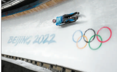
位于北京延庆的雪游龙雪车雪橇赛道，将会永久保留下来，并开设游客体验区。