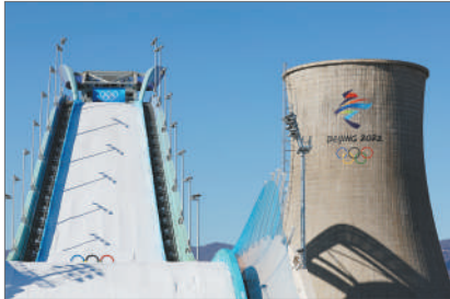
见证了中国队夺得两枚金牌的首钢自由式滑雪大跳台，将会永久保留下来。