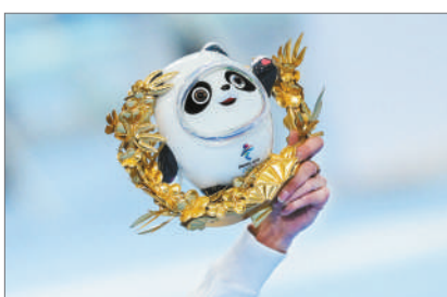
北京冬奥会上领奖台的选手都会获赠一枚冰墩墩。