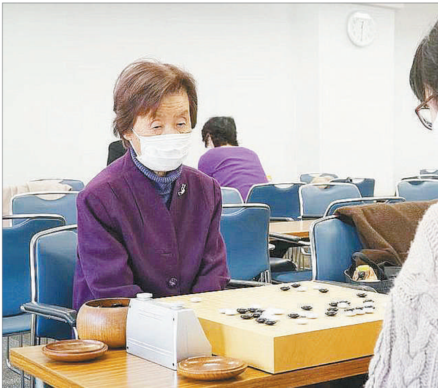
杉内寿子2021年在比赛中。