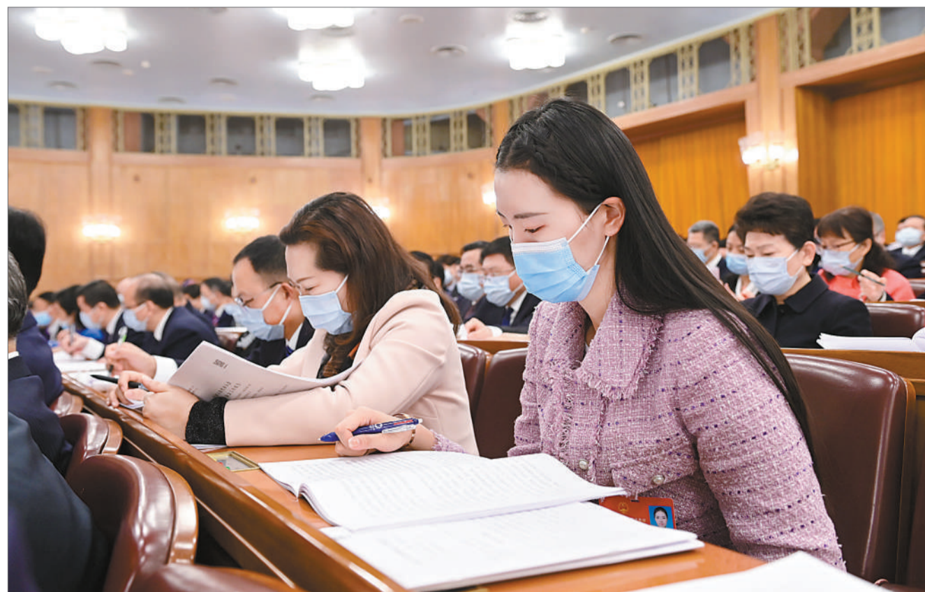
全国人大代表张常宁(右一)