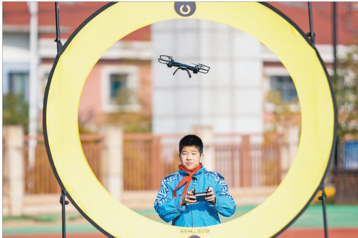
2021年12月14日，浙江省湖州市长兴县第一小学的学生操作无人机进行穿越训练。该校积极落实双减政策，通过开设无人机、机器人、创意编程等科创课程，拓宽学生的科技视野，提高学生的创新能力，让学生们感受科技魅力，快乐享受双减时刻，促进学生素质全面发展。视觉中国供图(资料图片)

级、年级的界限，甚至是穿越学科的界限时，学校必须对教育教学进行重新规划，打破多年来形成的惯性思维，对学校课程、课后服务、课堂教学和课堂下作业等多角度整体考虑学校教育的供给结构、内容结构。而其中第一个要提升的就是学校的教学管理。