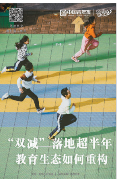
“双减”落地超半年 教育生态如何重构