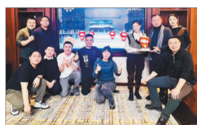
3月4日晚，设计团队成员一起观看了北京2022年冬奥会的开幕式。