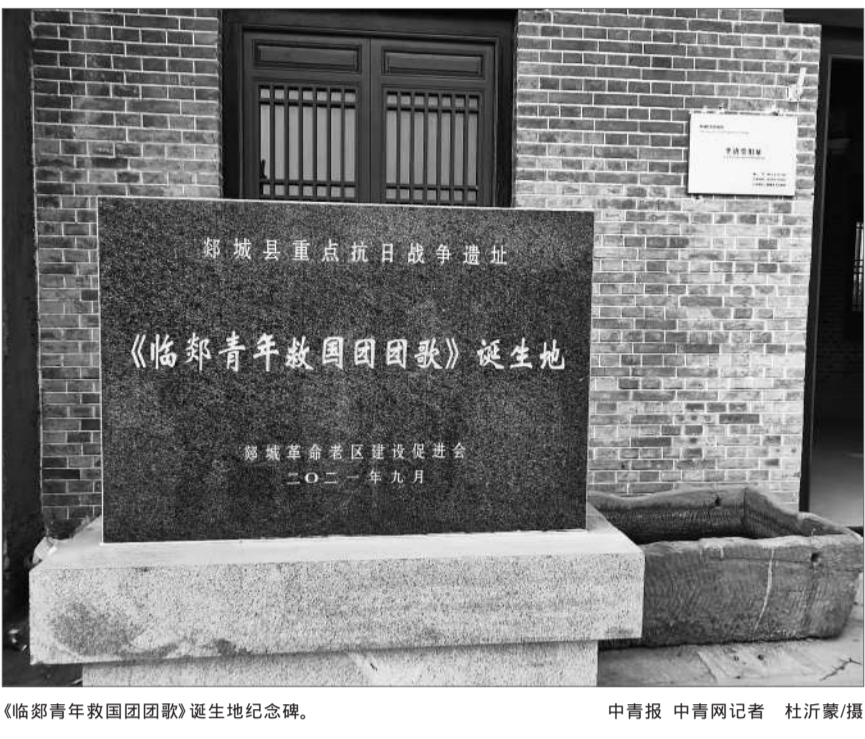
《临郑青年救国团团歌》诞生地纪念碑。

不仅如此,徐奎元还介绍了丁梦孙到其亲家所在的庄坞(今属兰陵县)开展工作。其间,丁梦孙曾邀请徐奎元在临郑青年救国团内担任领导职务,徐奎元考虑到各个方面因素,虽婉言谢绝,但引荐了自己的儿