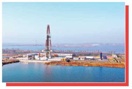
2021年11月4日,山东省东营市东营区的胜利油田莱113区块,员工在进行二氧化碳注入作业。

2020年9月,习近平主席在第七十五届联合国大会一般性辩论上指出,中国将提高国家自主贡献力度,采取更加有力的政策和措施,二氧化碳排放力争于2030年前达到峰值,努力争取2060年前实现碳中和。 这两个时间节点的目标内涵丰富,从近期来看,意味着中国疫后经济复苏要走一条绿色道路;从长远来看,2060年前实现碳中和,这个中国首次向世界宣示的减碳目标,将作为指挥棒引领中国转型为低碳大国。 2021年我国出碳达峰行动方案,启动全国碳排放权交易市场,积极应对气候变化。