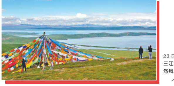
2020年7月23日,青海玉树,三江源国家公园自然风光。

9年间,北京PM 2.5 像坐上了滑梯,年均浓度从2013年的每立方米89.5微克,迅速降到2021年的33微克。2022年1月,北京宣布空气质量首次全面达标,创下全球超大城市空气治理改善的最快纪录,而这背后是我国跨越近10年的污染防治攻坚战。打赢污染防治攻坚战也是我国全面建成小康社会的重要内涵。 中央深改委第二十一次会议在审议《关于深入打好污染防治攻坚战的意见》时提到,近年来,我们推动污染防治的措施之实、力度之大、成效之显著前所未有。