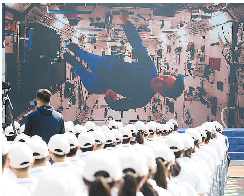
2021年9月1日,北京第五中学,同学们正在连线天宫空间站,实时与神舟十二号航天员进行“天地对话”。自1956年创建以来,我国航天事业实现了空间技术、空间应用、空间科学三大领域的长足发展。2021年6月17日航天员聂海胜、刘伯明和汤洪波乘坐神舟十二号载人飞船奔向太空,随着中国航天员入驻天和核心舱,中国太空“长征”迈出了新步伐。