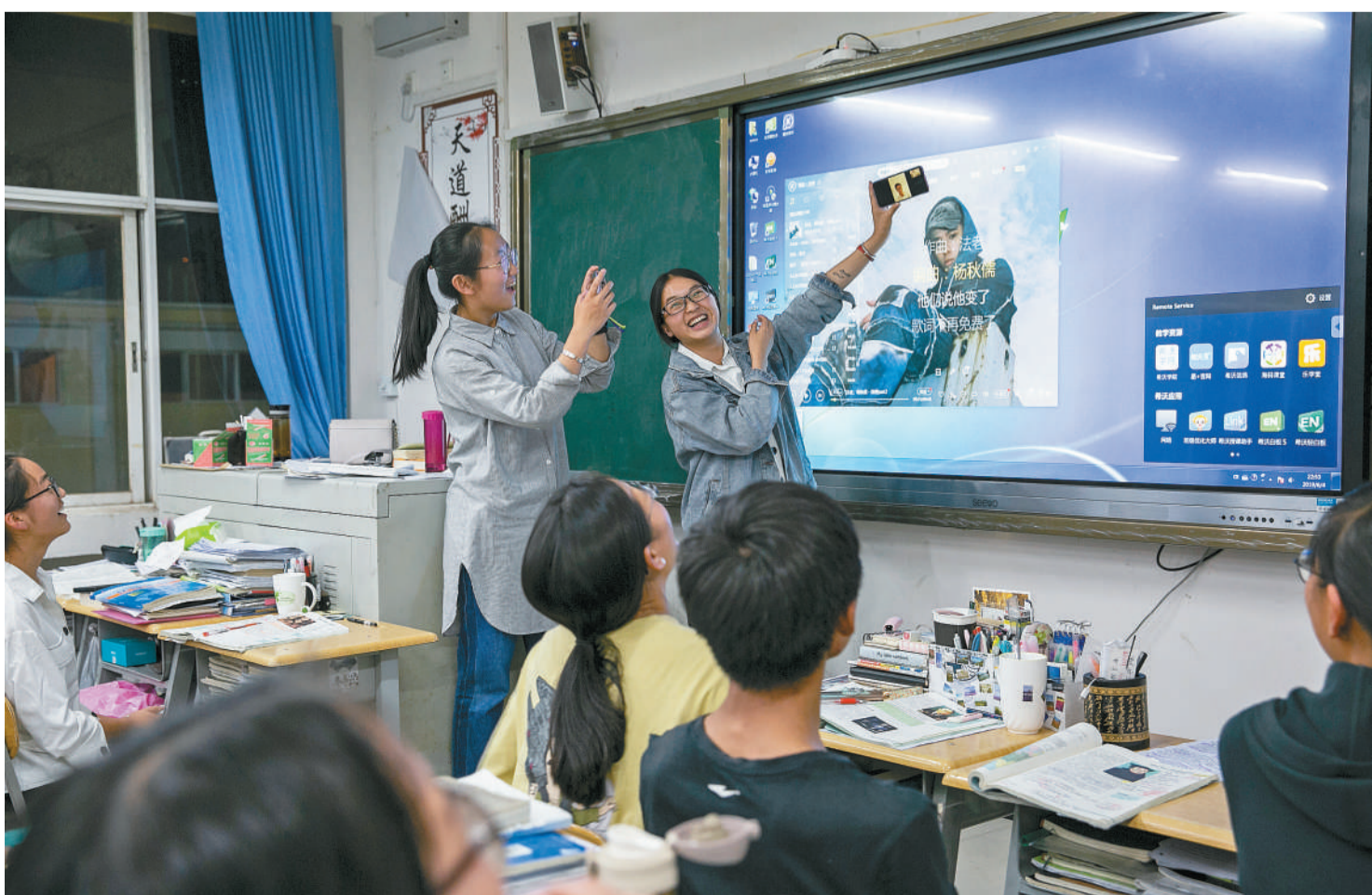
2019年6月4日,高考在即,云南禄劝一中高三文科网络培优班的同学们与班上在外地参加高考的同学视频通话,彼此加油。这块用于网络直播教学的屏幕,伴随他们从高一到高三。