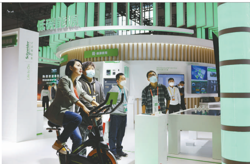
2021年11月7日,上海国家会展中心,第四届进博会技术装备展区,一名观众在体验低碳单车。2020年9月,我国政府在第七十五届联合国大会上提出,中国的二氧化碳排放力争于2030年前达到峰值,努力争取2060年前实现碳中和,碳达峰、碳中和成为热词。面对中国的庞大市场,许多外国企业早已把发展目标锚定到了双碳上。