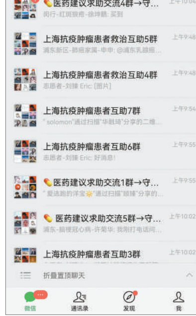
志愿者的微信群列表截图。

到目前,微信群志愿者总人数有200余人,常态化维护文档的有几十人,大学生们都是利用课余时间去联系