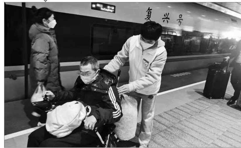
湖南铁道职业技术学院多年来组织志愿者在火车站开展微服务活动。图为今年春运期间，青年志愿者曾护送老人出站。