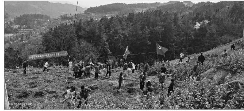
贵州遵义市道真侗族自治县组织教体系统党组织开展“造林护绿”系列主题活动，图为中学生在植树。