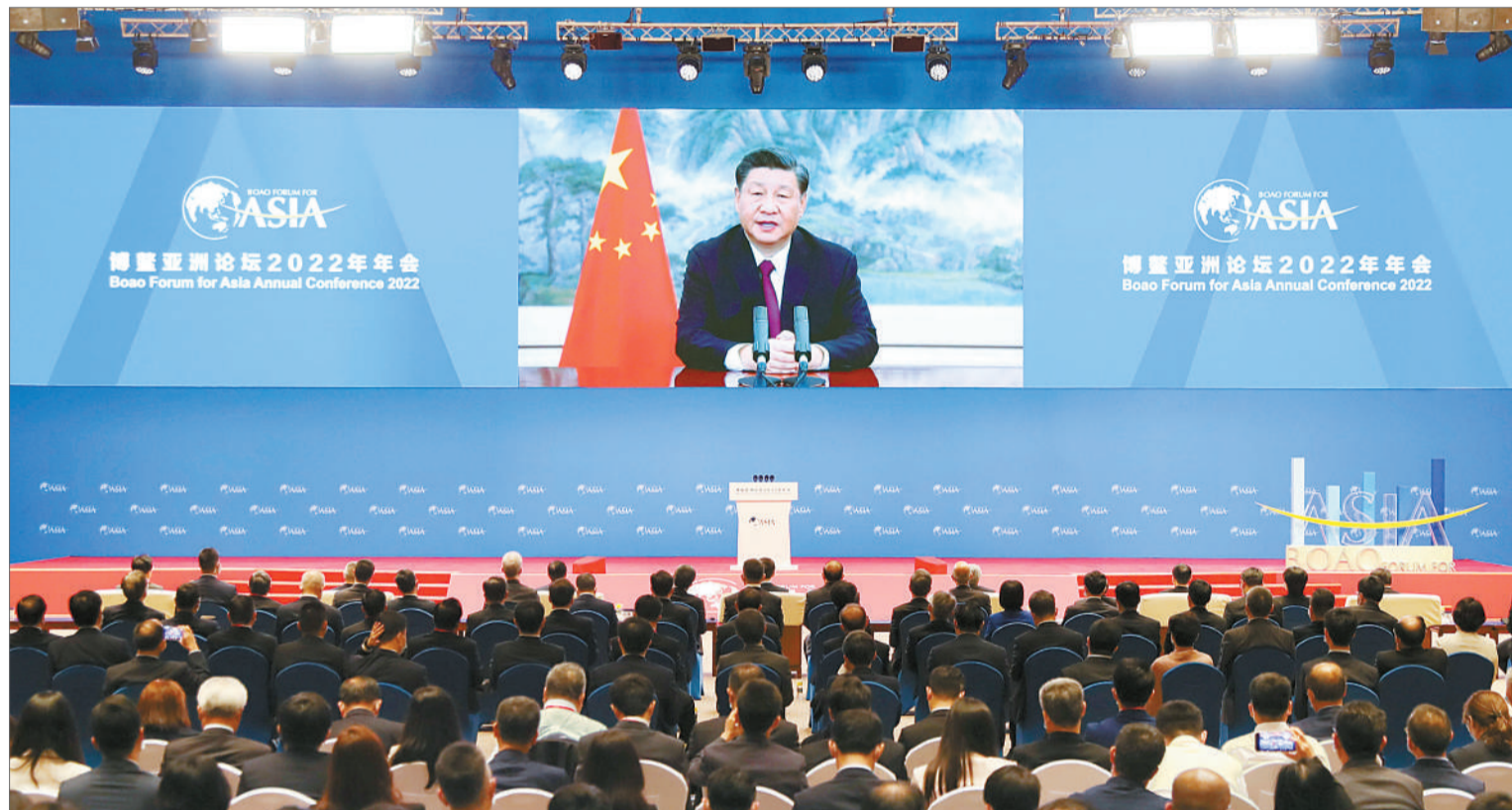
4月21日上午，博鳌亚洲论坛2022年年会开幕式在海南博鳌举行，国家主席习近平以视频方式发表题为《携手迎接挑战，合作开创未来》的主旨演讲。