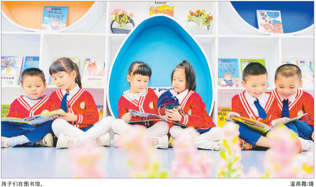
孩子们在图书馆。