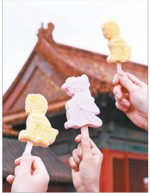
2021年7月22日，北京故宫售卖的文创雪糕。

10年前的故宫博物院，殿宇宏伟、底蕴深厚，但和年轻潮流似乎是沾不上边的。2012年9月，当时上任不久的故宫博物院第六任院长单霁翔，做了故宫讲坛第一讲，从故宫走向故宫博物院。之后，慢慢地又狠狠地，故宫博物院火了，开放面积从30%一路上涨到超过80%，全年几乎不分淡旺季，成为年轻人的潮流打卡地，每逢节假日和下雪天更是一票难求，而故宫文创更是引领全国博物馆进入了新的文创时代。