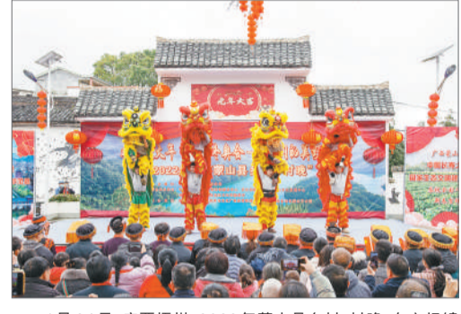
1月24日，广西梧州2022年藤县乡村村晚在文圩镇屯村村举行。这是全国乡村村晚示范点，由文化和旅游部公共服务司主办。

中国美术馆馆长吴为山认为，作为公共文化服务单位，做好公共文化服务是本职、天职。美术馆中