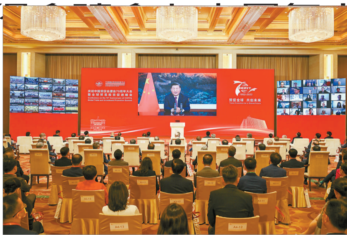
5月18日，国家主席习近平在庆祝中国国际贸易促进委员会建会70周年大会暨全球贸易投资促进峰会上发表视频致辞。

新华社北京5月18日电 5月18日，国家主席习近平在庆祝中国国际贸易促进委员会建会70周年大会暨全球贸易投资促进峰会上发表视频致辞。