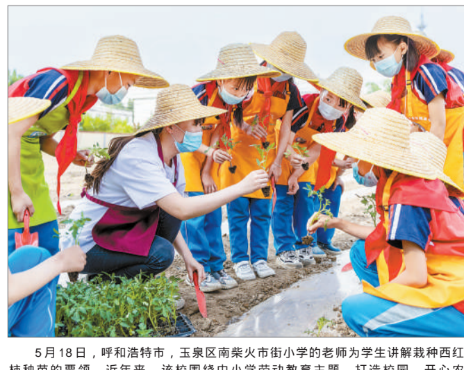
5月18日，呼和浩特市，玉泉区南柴火街小学的老师为学生讲解种植西红柿的要领。近年来，该校围绕中小学劳动教育主题，打造校园“开心农场”，让孩子们进田园、学农事，在劳动实践教育中提升素养。

积力，值得年轻的旅行者认真思考。随着人们对旅游体验和旅游质量提出更高期待，打卡式旅行渐行渐远。抵达一个新的地方，年轻人不满足于到此一游的拍照留念，更希望深入了解当地的历史沿革、风土人情、文化脉络。旅游与文化的关系越来越紧密，一趟缺乏文化含量的旅程是空洞无物的，这种新的旅游观念深入人心。就此而言，我们固然期待一场说走就走的旅行，但云旅游不仅是特殊时期的旅游替代品，更是丰富旅游内涵、增加旅程厚度的必然产物。(下转2版)